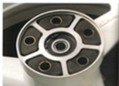
マルケジーニの5本スポーク・マップと共通のスクリーン・パーシステムを採用し、耐久性を向上させている