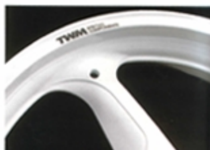
デザインはマルケのものだが、マルケ製品に見られる“C”で鍛造された“m”の刻印はない。独自の鋳型を使用して、1.2kg

重量的には、さすがにマグやアルミの鍛造ホイールには及ばないものの、例えばゼファー1100用ではフロントが4.3kg(ノーマル比83%)、リヤが7.3kg(同69%)と、前後トータルで4.2kgの軽量化を達成。これで前後セット価格150,000円というお手頃感は、まさに鍛造アルミホイールだからこそ実現できたといえるだろう。